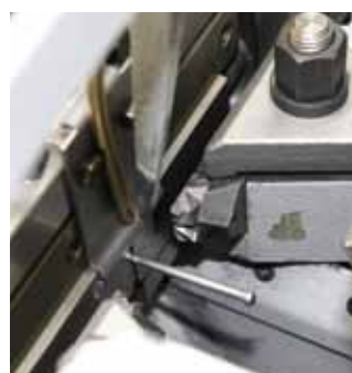
▲ Herstellung Blindnietstifte