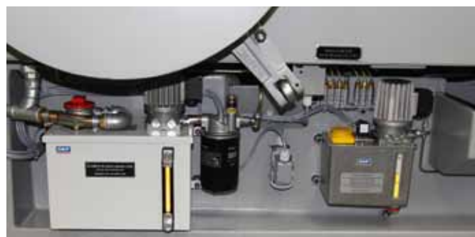
▼ Wartungseinheit und Automatische Öl-Zentralschmierung