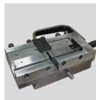
▲ Backenkasten (austauschbar)